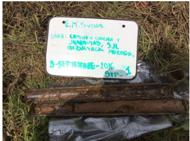
PERFORACIÓN DE PRUEBA DE PENETRACIÓN ESTÁNDAR SONDEO STP-1