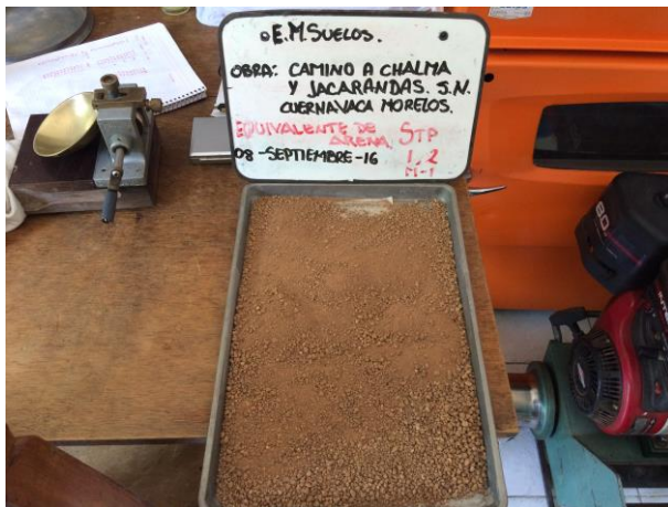
EQUIVALENTE DE ARENA MALLA #4