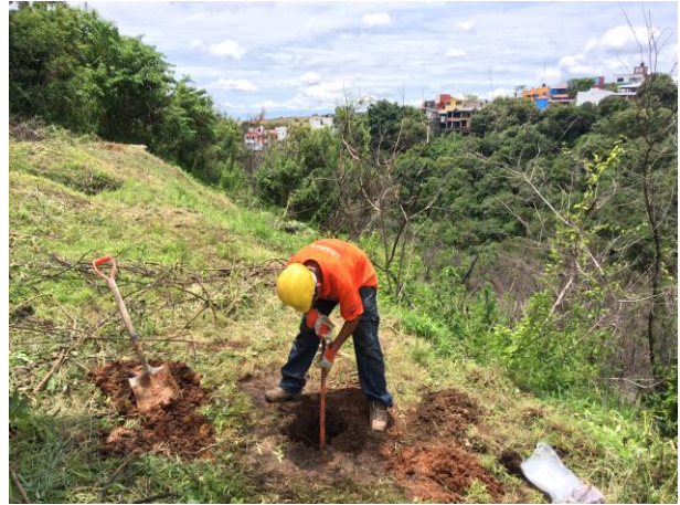
POZO A CIELO ABIERTO PCA-2 PARA MUESTREO ESTRATIGRÁFICO