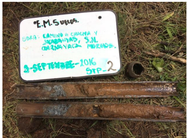
PERFORACIÓN DE PRUEBA DE PENETRACIÓN ESTÁNDAR SONDEO STP-2