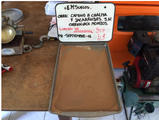
LIMITES MALLA #40