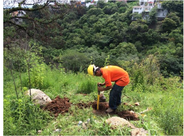
POZO A CIELO ABIERTO PCA-1 PARA MUESTREO ESTRATIGRÁFICO