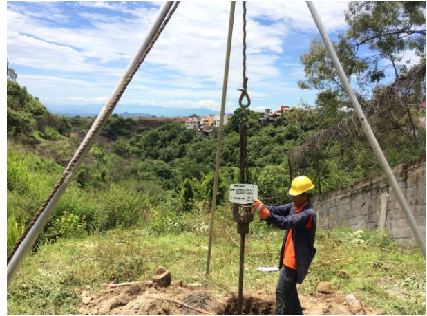
PRUEBA DE PENETRACIÓN ESTÁNDAR SONDEO STP-3