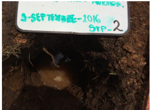
POZO A CIELO ABIERTO PCA-2 PARA MUESTREO ESTRATIGRÁFICO