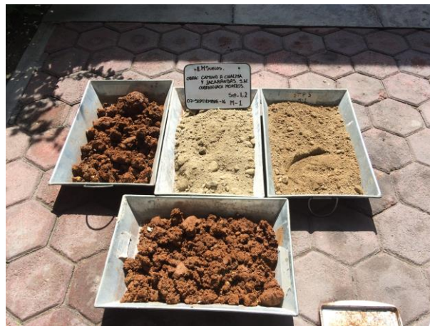
SECADO DE MUESTRAS