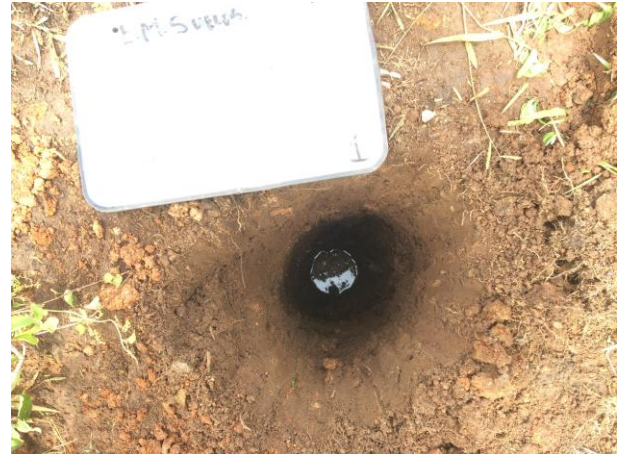
POZO A CIELO ABIERTO PCA-1 PARA MUESTREO ESTRATIGRÁFICO