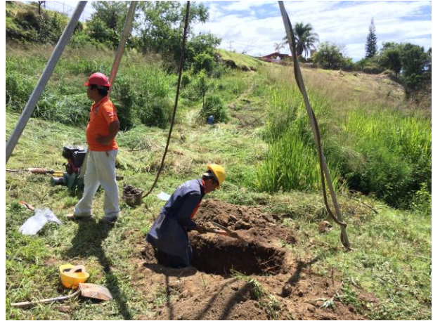
POZO A CIELO ABIERTO PCA-3 PARA MUESTREO ESTRATIGRÁFICO