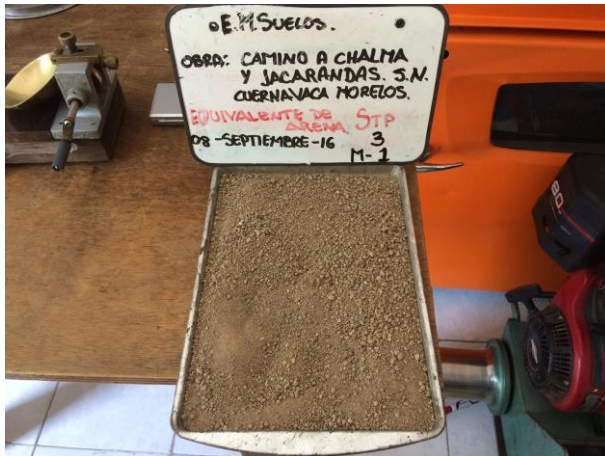
EQUIVALENTE DE ARENA MALLA #4