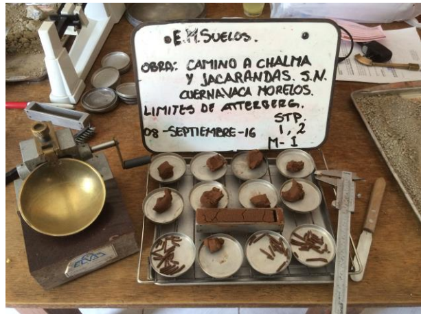
LÍMITES DE ATTERBERG