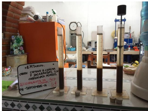
EQUIVALENTE DE ARENA