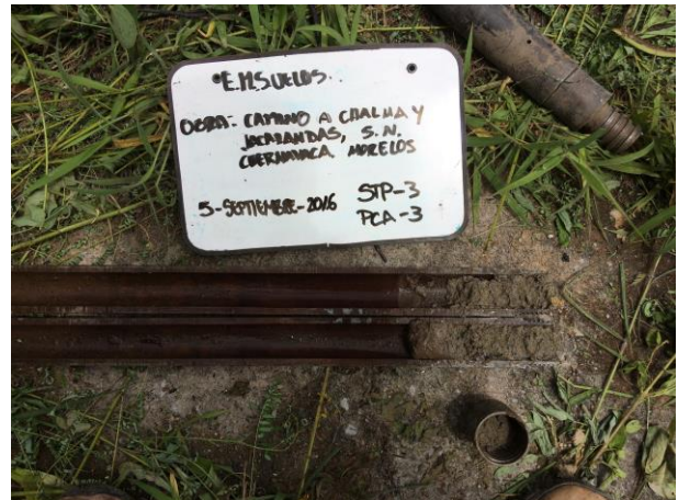
PERFORACIÓN DE PRUEBA DE PENETRACIÓN ESTÁNDAR SONDEO STP-3