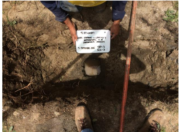
POZO A CIELO ABIERTO PCA-3 PARA MUESTREO ESTRATIGRÁFICO