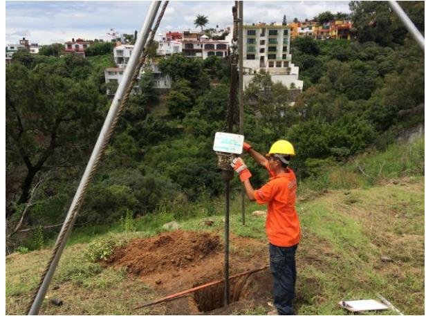
PRUEBA DE PENETRACIÓN ESTÁNDAR SONDEO STP-1