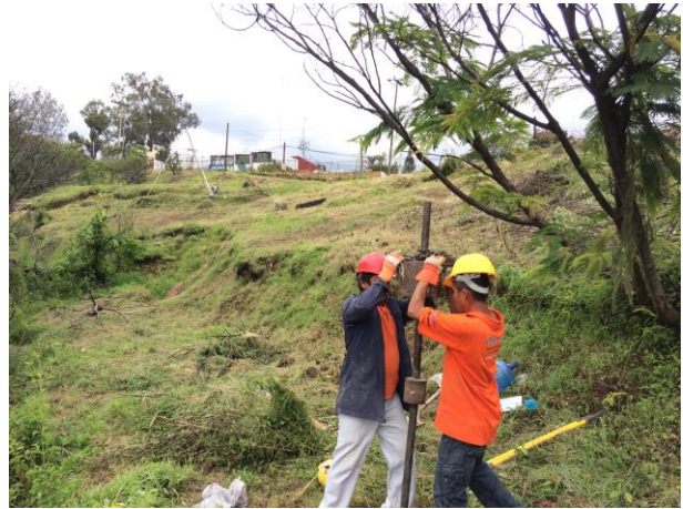
PRUEBA DE PENETRACIÓN ESTÁNDAR SONDEO STP-2